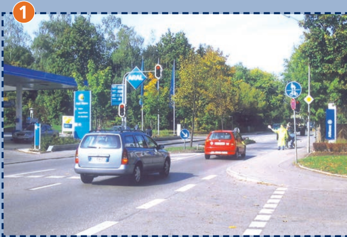
Lochhausener Straße Fußgängerampel zur Schule Schussenrieder Straße