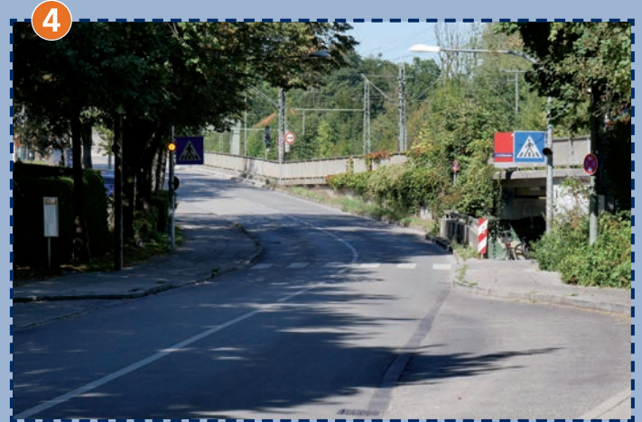
Henschelstraße – Zugang zur S-Bahn Lochhausen