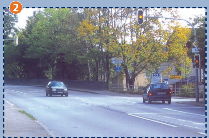
Kreuzung Lochhausener Straße/Sumpfmeisenweg/Rohrsängerplatz